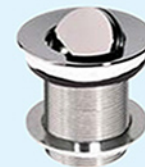
K-12-PC K-12-BN K-12-PB K-12-PN